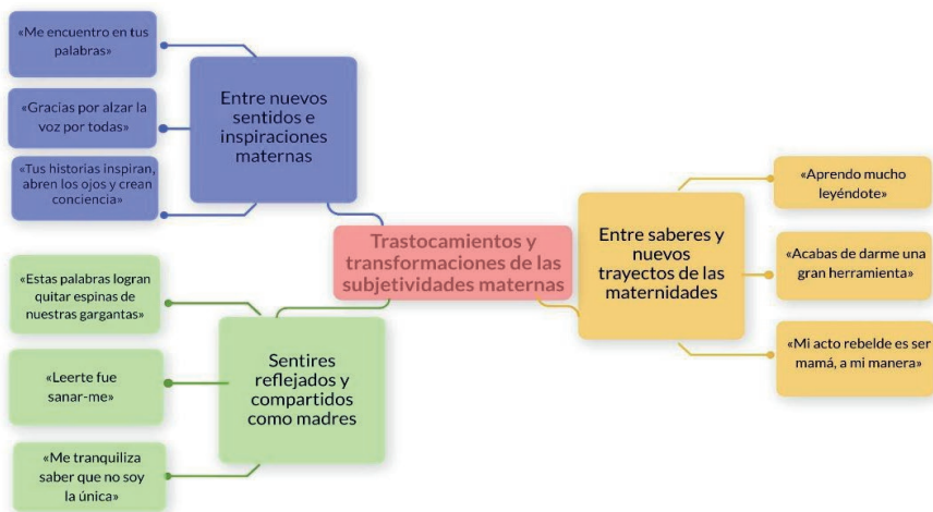
Figura 1 Categorización, trastocamientos y transformaciones de las subjetividades maternas

que acontecen en sus subjetividades mediadas por los encuentros, los contrastes y las sintonías digitales. Así, las categorías “entre nuevos sentidos e inspiraciones maternas”, “sentires reflejados y compartidos como madres” y “apertura a otros saberes y trayectos de las maternidades”, retoman diversas formas como nuestros sentidos, sentires, saberes y prácticas como madres se movilizan, amplían y transforman a través de lo digital, tal como se muestra en la figura 1.