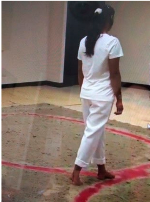
FOTOGRAFIA 4. Performance “70+2”.

FUENTE: Autora de la fotografía Patricia Ruíz-Bayón; Obra: Patricia Ruíz-Bayón. Performance “70+2”; De la serie TSVYC (Todos somos víctimas y culpables). Video, EL COLEF Matamoros Tamaulipas, 2013; Autorización para reproducir imagen: cortesía de la artista.