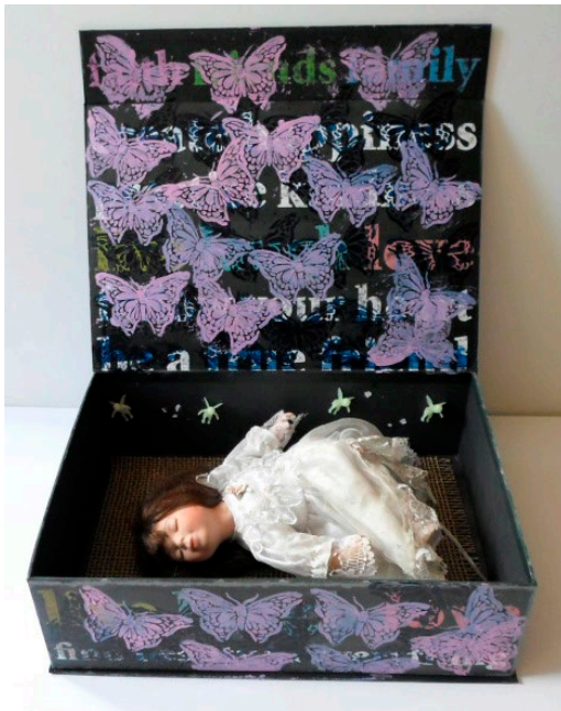
FOTOGRAFIA 2. Ángel Dormido.